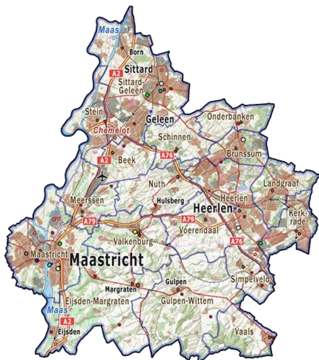
Fig. 2 Zuid-Limburg

In dit hoofdstuk worden de kenmerken van de regio Zuid-Limburg getypeerd qua geografie, gemeenten en ligging ten opzichte van de binnen- en buitenlandse buurregio's.