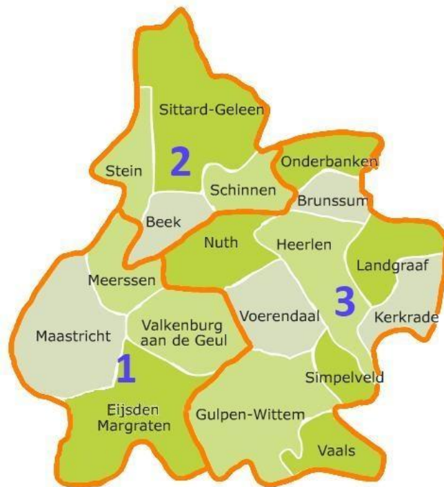
Fig.3 Overzicht gemeenten Zuid-Limburg

De regio kenmerkt zich als een compact verstedelijkt gebied van 30x30 km. Er zijn grote industrieën met specifieke veiligheidsrisico's, zoals chemische industrie (Chemelot) en een luchthaven (Maastricht-Aachen Airport). Met name in de zomermaanden komen veel toeristen naar de regio. Er zijn veel grootschalige (sport-, cultuur- en/of historische) evenementen, waterrecreatie en bezoekers van de (wekelijkse) markten uit de Euregio Maas-Rijn.