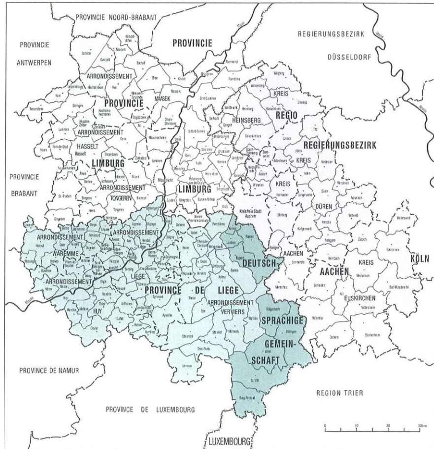
Fig.4 Ligging van de regio Zuid-Limburg in de Euregio Maas-Rijn

Dit heeft grote consequenties voor de rampenbestrijding en crisisbeheersing. Enerzijds is de regio voor bijstand bijna geheel aangewezen op de aangrenzende landen, terwijl anderzijds de risico's op het grondgebied van de aangrenzende landen (grote) gevolgen kunnen hebben voor de eigen regio. Een goede euregionale samenwerking is derhalve één van de meest belangrijke succesfactoren voor de rampenbestrijding en crisisbeheersing in Zuid-Limburg.